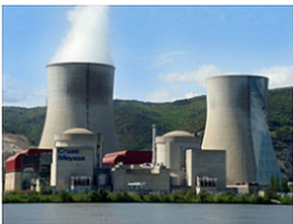
Centrale de Cruas Meysses, Ardèche

Au niveau actuel de consommation, les ressources d'uranium exploitables sont estimées à environ 80 années au niveau actuel de consommation. Néanmoins, que ce soit du fait des coûts globaux du nucléaire, du risque technologique, accru par le poids croissant du changement climatique par exemple, ou du fait des difficultés d'approvisionnement en minerais d'uranium, on trouve ici encore une raison supplémentaire de travailler sur le long terme à une alternative au nucléaire.