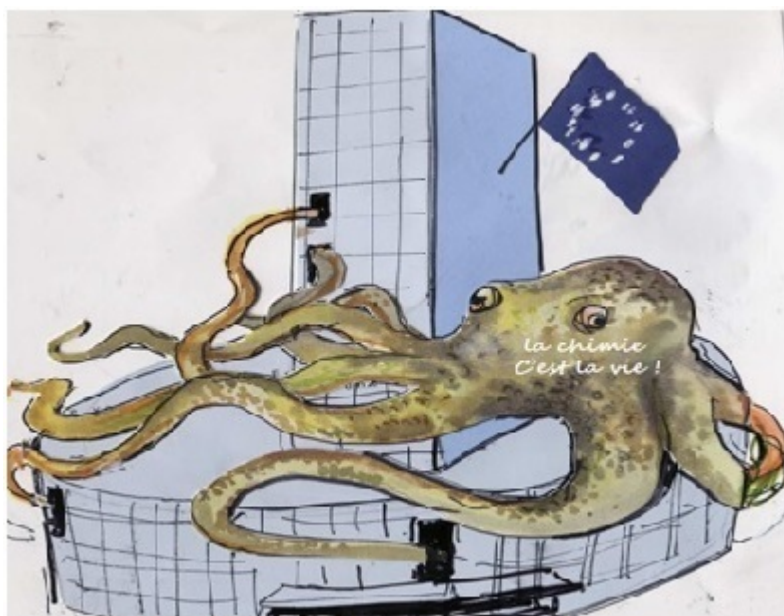
Les lobbies à l'œuvre à Bruxelles

À la suite des multiples alertes, mettant en cause des substances très diverses, mentionnées dans le raccourci historique du point A pour les années 80-90, une prise de conscience européenne de ces dangers a amené la Commission à annoncer dès l'an 2000 la préparation de critères définissant clairement les PE et d'une liste de substances à évaluer en priorité pour leur activité PE (effets constatés et exposition humaine importante par usage personnel ou domestique, ou forte persistance environnementale), à partir de 564 substances candidates proposées à cette époque. Simultanément le Parlement Européen prenait une résolution pour l'application aux PE du principe de précaution, et le recensement des substances demandant une action immédiate.