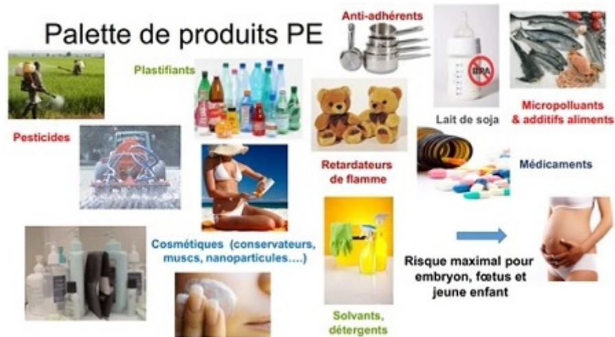
La « palette » des produits qui nous exposent aux P.E. ?