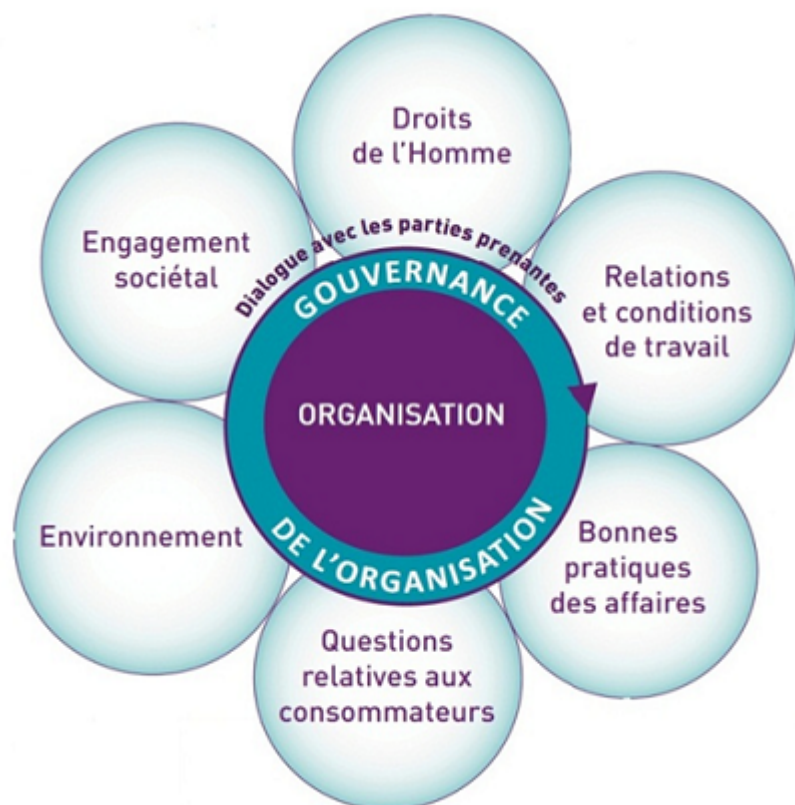
Fig. 2 - Norme ISO 26000 : les 7 domaines d'actions

Le dialogue social pourrait en être profondément modifié tant en interne de l'entreprise, qu'en externe, avec les acteurs du territoire.